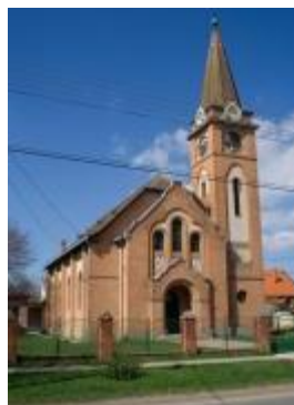
Fegyverneki ref. templom